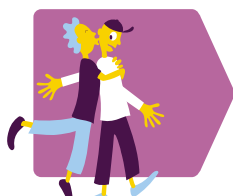
Relaties en seksualiteit