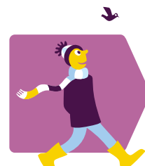
Milieu en natuur