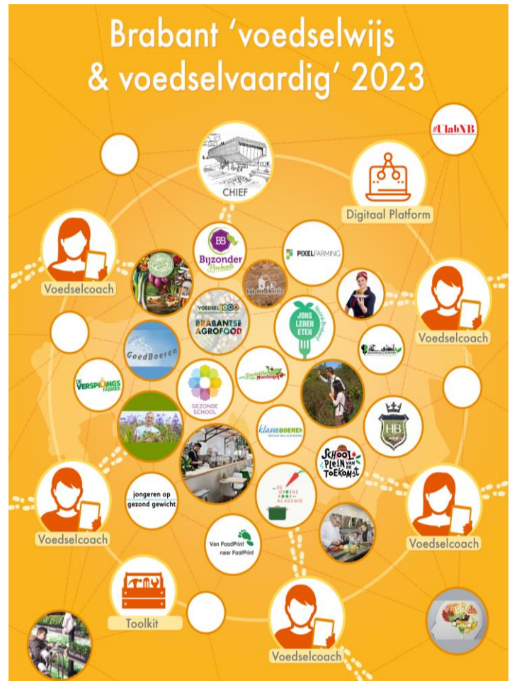
Overzicht met de rol van de voedselcoaches t.o.v. de andere partijen.

Meer informatie over de Voedsel 1000 vind je hier . Of bekijk één van de vlogs met meer informatie.